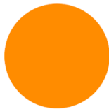
A defined, rigid particle.