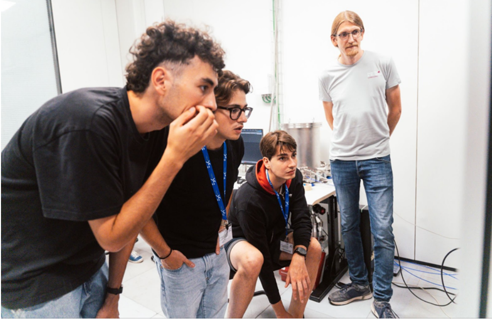
Classe e faculty